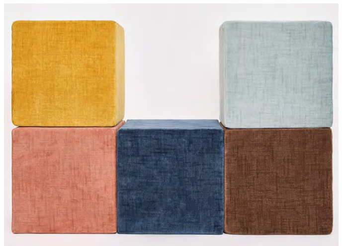
▲ COSMOS (コスモス) ¥36,190/m 全30色 生地巾140cm by PEPE PEÑALVER 『COSMOS』

マーチンデール 50,000 回の耐摩耗性を備えた、防汚加工済みの柔らかな手触りのシェニール織です。