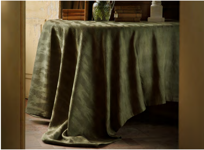
▲ NOCTARA (ノクタラ) ¥43,780/m 全6色 生地巾140cm by LIZZO 『ECHO』

静寂と期待が満ちる劇場の薄明かりを想い起させる、“夜”から着想を得たデザインです。