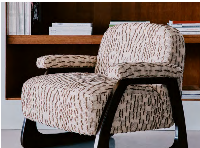
▲ SWING (スウィング) ¥49,940/m 全5色 生地巾140cm by PEPE PEÑALVER 『GROOVE』

光と影の表情が流れるような動きを生み出しています。ジャズの穏やかなリズムを思わせるデザインです。