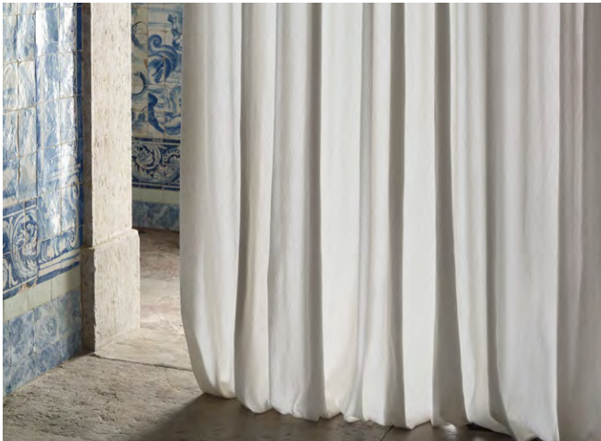
▲ FONTAINE (フォンテーヌ) ¥72,600/m 全4色 生地巾305cm by LIZZO 『LES JARDINS』

マット面とサテン面をもつリバーシブルカーテンです。優雅な表情が噴水のような軽やかさを空間にもたらしめます。