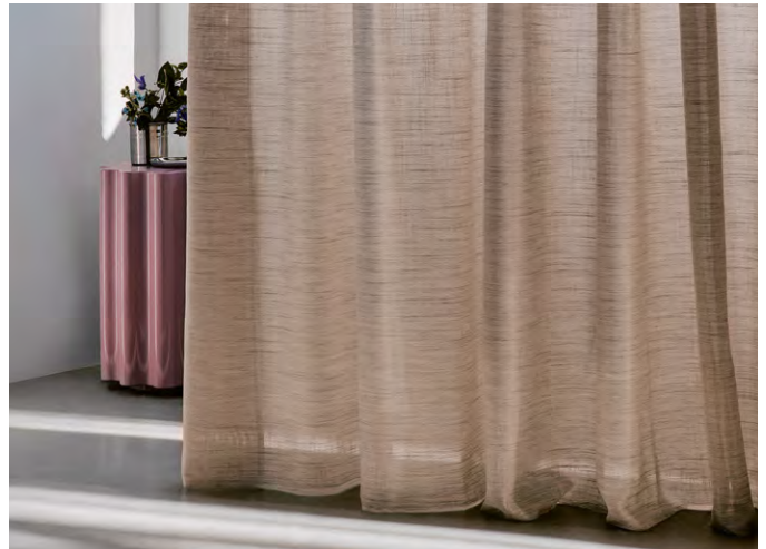
▲ BASALT (バサルト) ¥34,980/m 全7色 生地巾330cm by PEPE PEÑALVER 『MAUNA』

リネン調の広幅の防炎シアーで、火山岩を思わせるニュートラルカラーを揃えています。