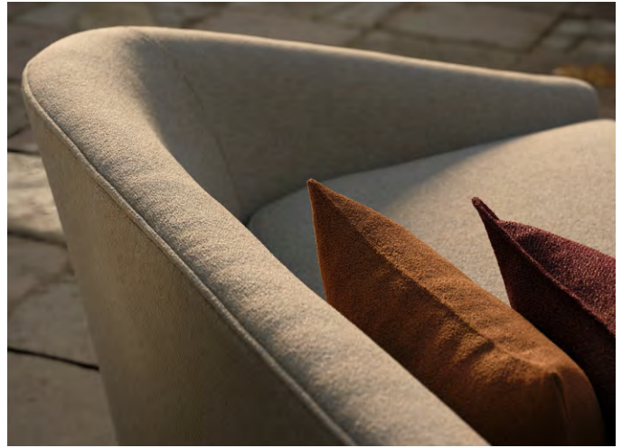
▲ LOGGIA (ロτζヂア) ¥45,650/m 全16色 生地巾140cm by LIZZO 『LOGGIA』 indoor/outdoor

空間の建築的構成を引き立て、過度に主張することなく調和します。耐久性・機能性・美しさを兼ね備えたファブリックスです。