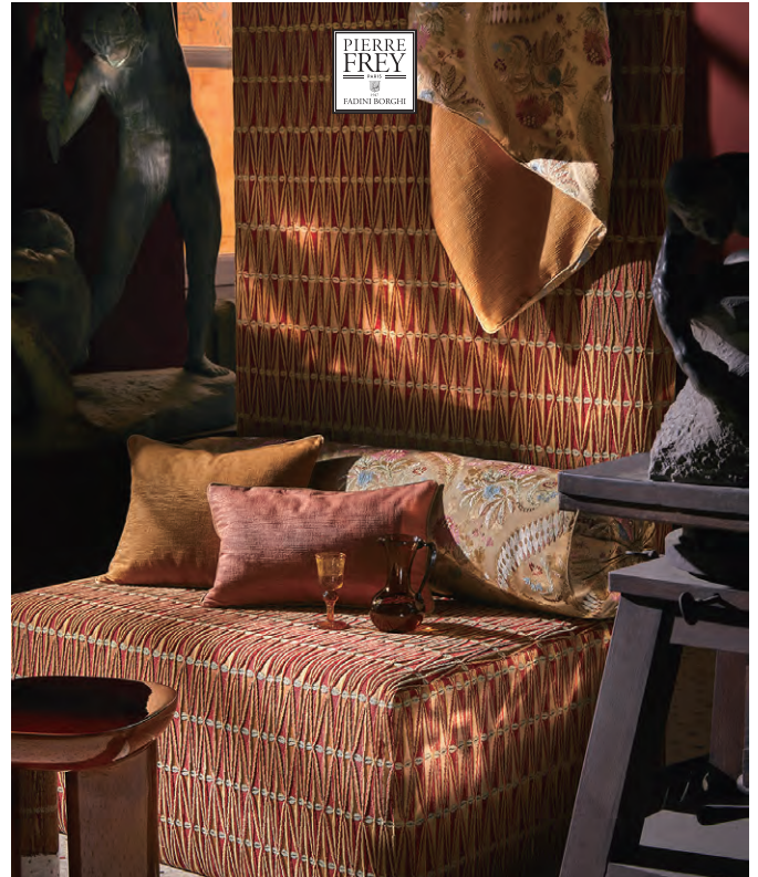
▲ VESUVIO (ヴェスヴィオ) 全3色 ¥68,090/m 生地巾 137cm

幾何学模様のベルベットに、ストライプや貝殻モチーフが重なり合うデザインです。ポンペイの装飾に見られる水辺の生き物を思わせる、優雅で奥行きのある表情が魅力です。