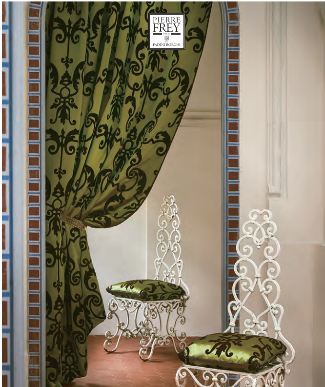
▲ NAPOLI (ナポリ) 全2色 ¥83,270/m 生地巾 139cm

ポンペイの古代装飾に着想を得た繊細な模様と、丁寧に織り上げられた立体感のある表現が特徴です。クラシックで飽きのこない上品なファブリックスです。