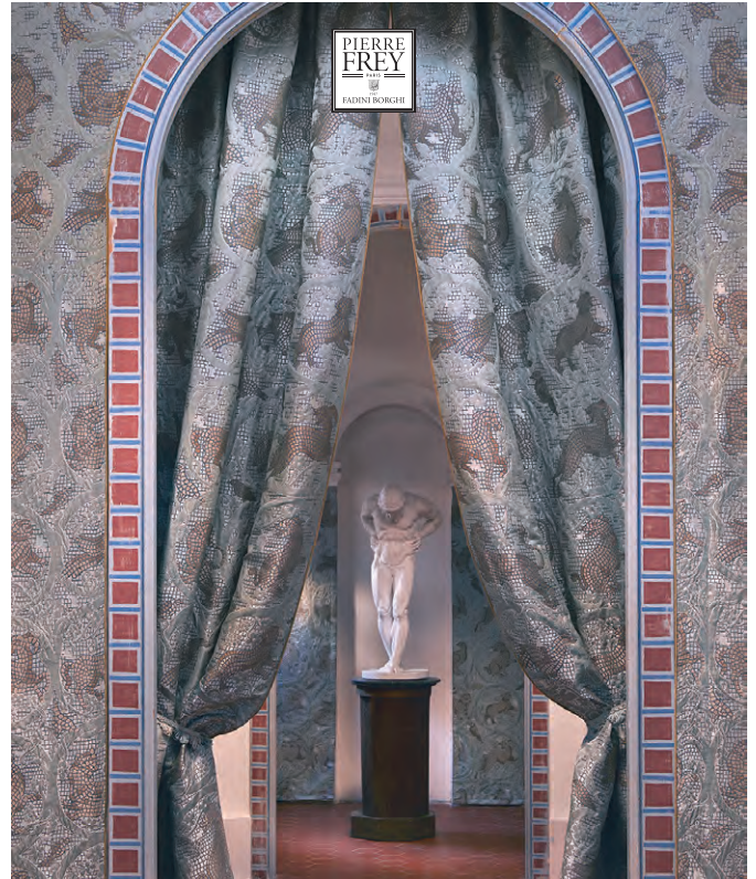
▲ MISÈNE (ミゼーネ) 全2色 ¥111,430/m 生地巾 140cm

ポンペイのモザイクから着想を得た、動物モチーフのシルク混合のファブリックスです。きらめく表情と幾何学的な構成が空間を華やかに演出します。