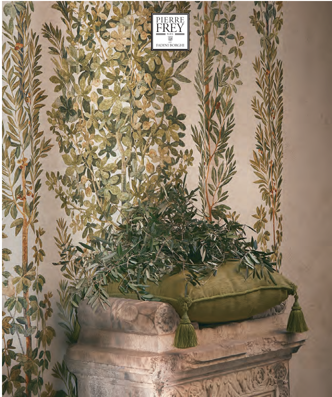
▲ POMPEI (ポンペイ) ¥71,500/m 生地巾 140cm

ポンペイの植物を描いたフレスコ画をリネンにプリントしたデザインです、時を経たような表現が庭園の雰囲気と、植物のやわらかな美しさを映し出しています。